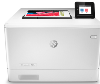
HP Color LaserJet Pro M454dw

Imprimante avec sécurité dynamique activée. Uniquement destinée à être utilisée avec des cartouches dotées d'une puce authentique HP. Les cartouches dotées d'une puce non HP peuvent ne pas fonctionner et celles qui fonctionnent actuellement pourraient ne plus fonctionner à l'avenir. Pour en savoir plus, consultez :